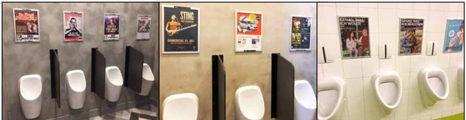
Plakatflächen je Standort

UNÜBERSEHBAR ZIELGRUPPEN GENAU GESCHLECHTESPEZIFISCHE WERBUNG KOSTENEFFIZIENT