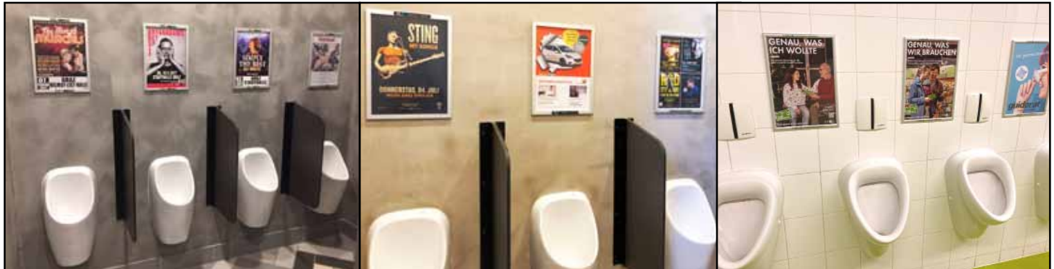
Plakatflächen je Standort

UNÜBERSEHBAR ZIELGRUPPEN GENAU GESCHLECHTESPEZIFISCHE WERBUNG KOSTENEFFIZIENT